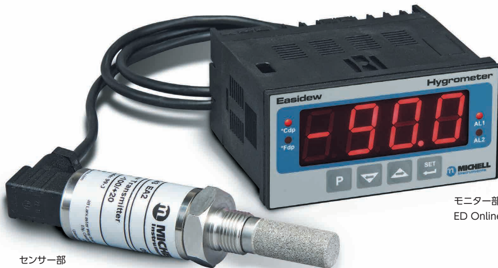
センサー部 静電容量式 ED Transmitter

卓上/パネル取付型があり、大型LEDデジタル表示、アナログ/デジタル出力および2つの警報接点出力を標準装備しています。温度補正機能を搭載しています。(※ED Transmitter内蔵機能)